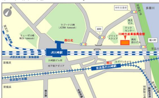
※当館をご利用の際は、電車、バスをご利用ください。 JR川崎駅から徒歩8分、京浜急行川崎駅から徒歩7分